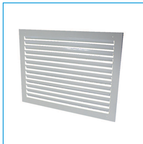
Решетка декоративная VKR(D)

Решетка RAL9016 оклеена защитной пленкой, которую необходимо удалить после монтажа.